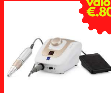
Omaggio Fresa PRO + Kit